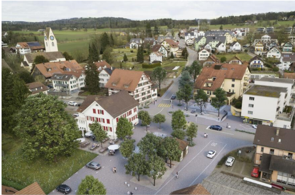
Innovatives, nachhaltiges und lebendiges Ottenbach