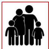
Kinder & Familien