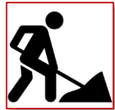
Dorfplatz & Strassen